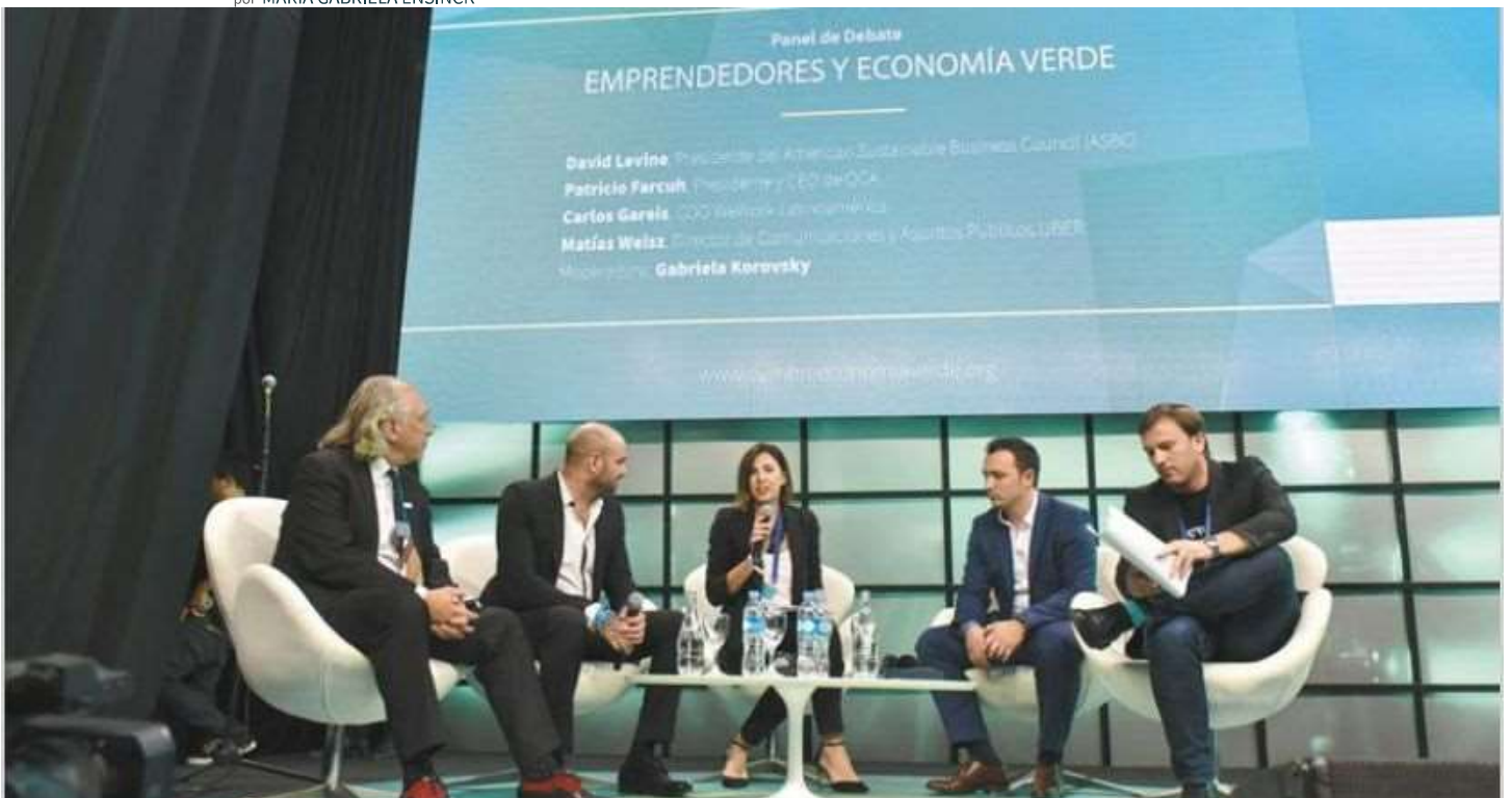
CEOs de Uber, OCA y Wework, en la discusión moderada ...

El cambio climático y los desastres ambientales están entre las mayores amenazas humanitarias, pero también pueden ser una oportunidad de generar empleos y nuevos negocios. Diversos casos fueron presentados ayer en la Cumbre de Economía Verde.