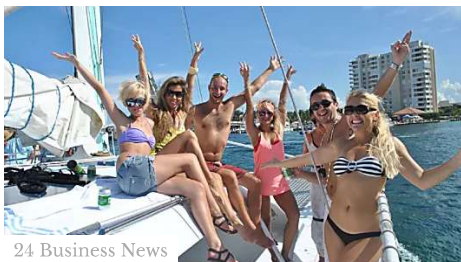
24 Business News